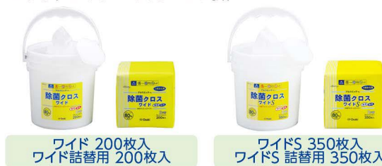
ワイド 200枚入 ワイド詰替用 200枚入