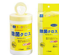
80枚入 / 詰替用 80枚入