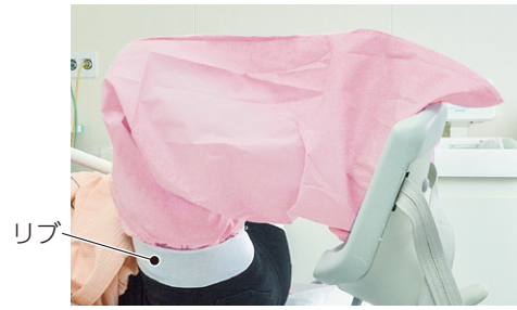
※画像はリブの折り返しを伸ばした状態です。